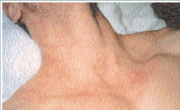
Plasmatischer Effekt nach einer DMK-Enzymmaske – man sieht das Kapillargefäßsystem unter der Haut als Zeichen einer guten Sauerstoffversorgung

Einige enzymatische Verfahren erzeugen durch eine Weitstellung der peripheren Kapillaren eine Art plasmatische Aktion in der Haut. Die Forscher gehen davon aus, dass eine er-